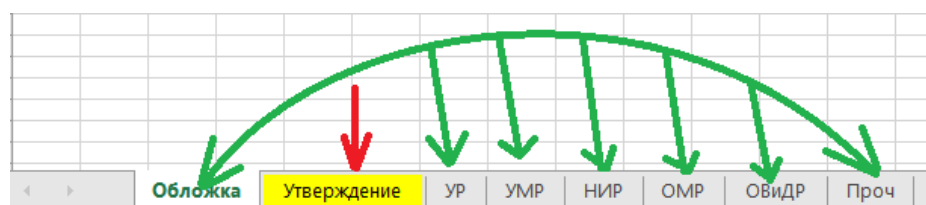
Рисунок 2 – Демонстрация необходимых для заполнения листов Excel

После заполнения преподавателем всех листов индивидуального плана (на рисунке 2 зелеными стрелочками показаны листы, которые необходимо заполнить преподавателю) он отправляется на проверку зав. кафедрой и декану факультета, после утверждается на соответствующем листе Excel с указанием ФИО утверждающего, даты и номера протокола заседания. Страница утверждения находится на втором листе Excel документа, выделена желтым цветом и имеет наименование - "Утверждение" (данный лист отмечен красной стрелочкой на рисунке 2).